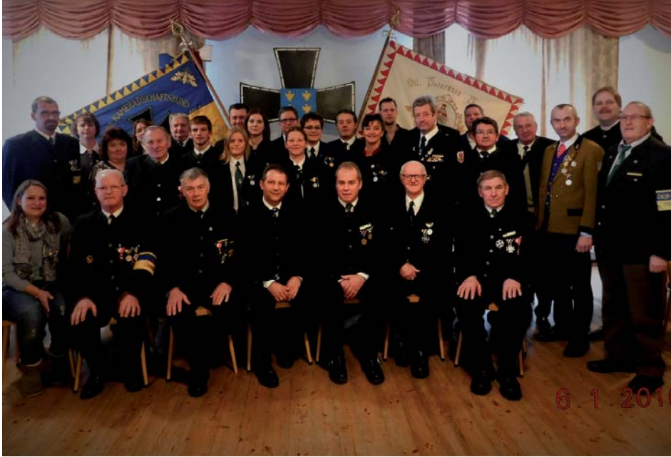
Bei den Neuwahlen des Kameradschaftsbundes, OV Kilb wurde der bisherige Vorstand einstimmig wiedergewählt.

Am 06.01.2016 hielt der Kameradschaftsbund OV Kilb seine Jahreshauptversammlung im Gasthaus Fischl ab. Bei den Neuwahlen wurde der bisherige Vorstand einstimmig wiedergewählt. Der Kameradschaftsbund, OV Kilb hat 184 Mitglieder, davon 19 Kameradinnen.