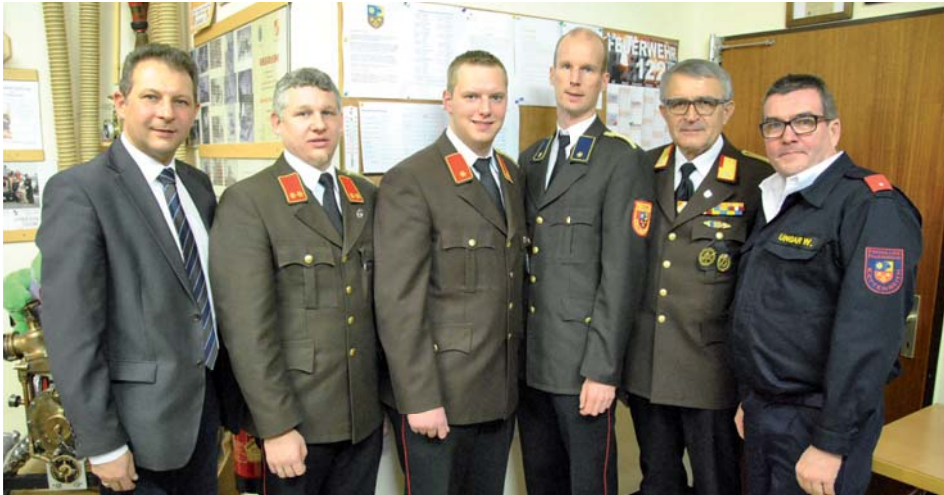
Keine großen Veränderungen brachten die Neuwahlen bei der FF Kettenreith.