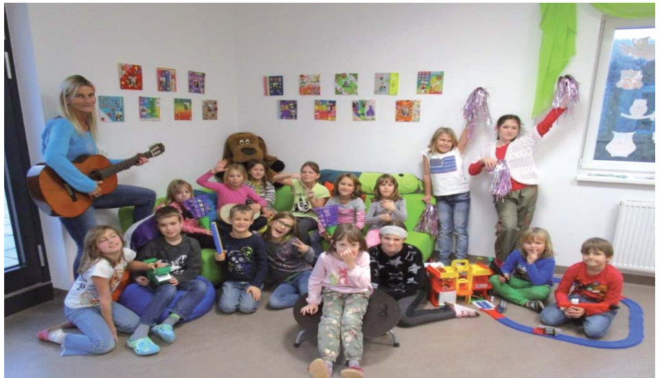
Erstmals soll es in den Ferienmonaten die Möglichkeit einer Ferienbetreuung für Schülerinnen und Schüler geben.

Der Gemeinderat hat daher beschlossen im Jubiläumsjahr die Kulturwerkstätte Kilb einmalig mit dem Betrag von €7.000,00 zu unterstützen.