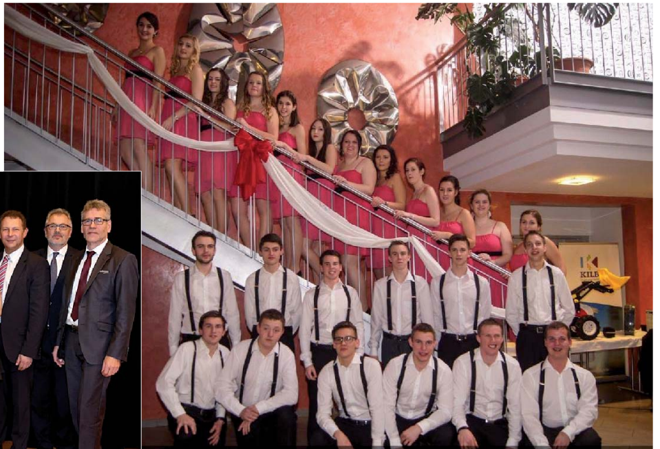
Auch beim Ball für Jung und Alt herrschte beste Stimmung im K4.

Am 3. Jänner fand das 1. Neujahrskonzert von musica spontana im K4 in Kilb statt, welches gemeinsam mit der Kulturwerkstätte Kilb organisiert wurde.