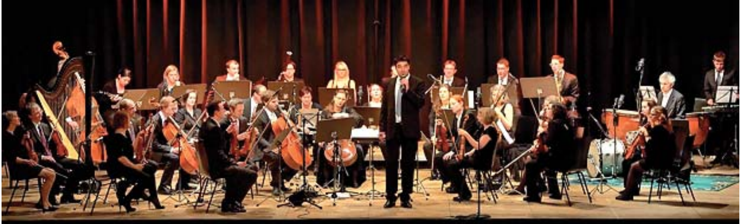
Mit einem schwungvollen Neujahrskonzert erfolgte der kulturelle und musikalische Jahresauftakt im K4.

Am 3. Jänner fand das 1. Neujahrskonzert von musica spontana im K4 in Kilb statt, welches gemeinsam mit der Kulturwerkstätte Kilb organisiert wurde.