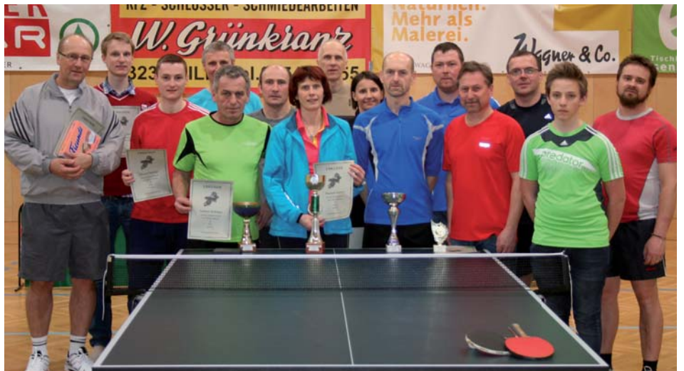
Viel Spaß und gute Laune herrschte bei den Teilnehmern des ersten Kilber Hobby Tischtennisturnieres in der Sporthalle Kilb.

Hervorzuheben sind auch die tolle Organisation sowie die fleißigen Helfer im Hintergrund, die dieses Turnier zu