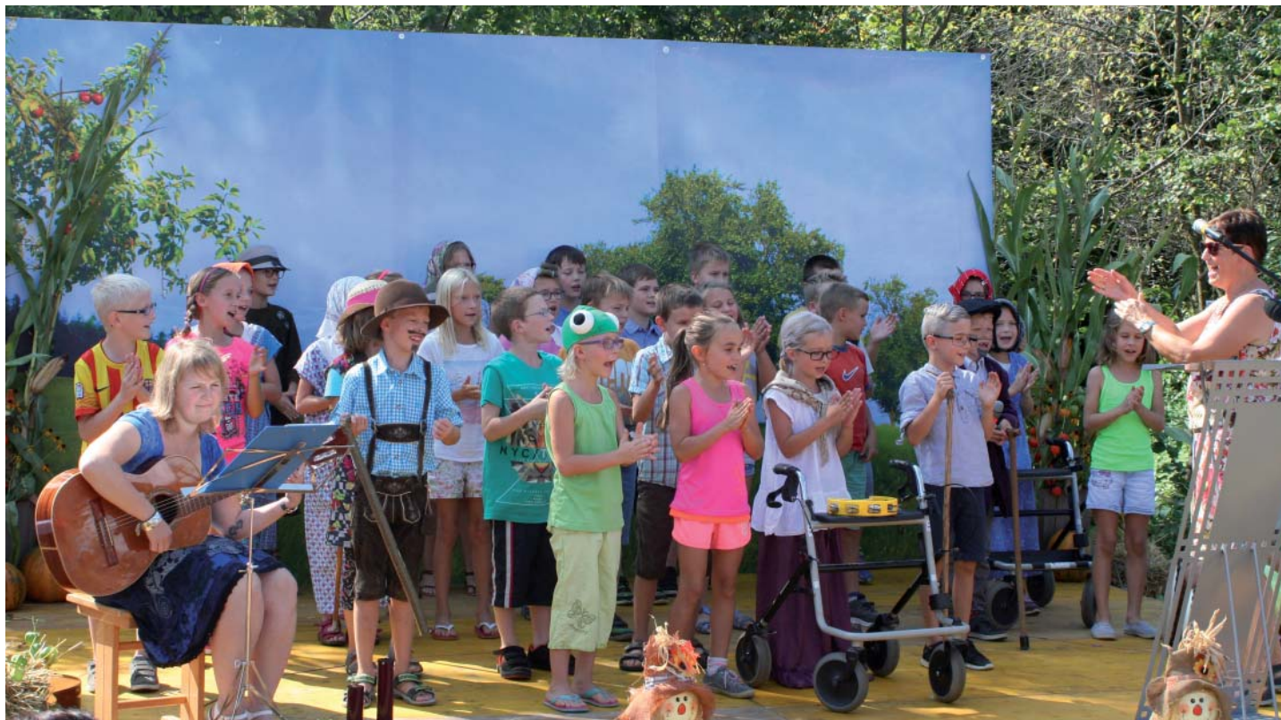
Für eine gelungene musikalische Umrahmung des Festaktes sorgten mit viel Schwung und Spaß die Kinder der Volksschule Kilb.