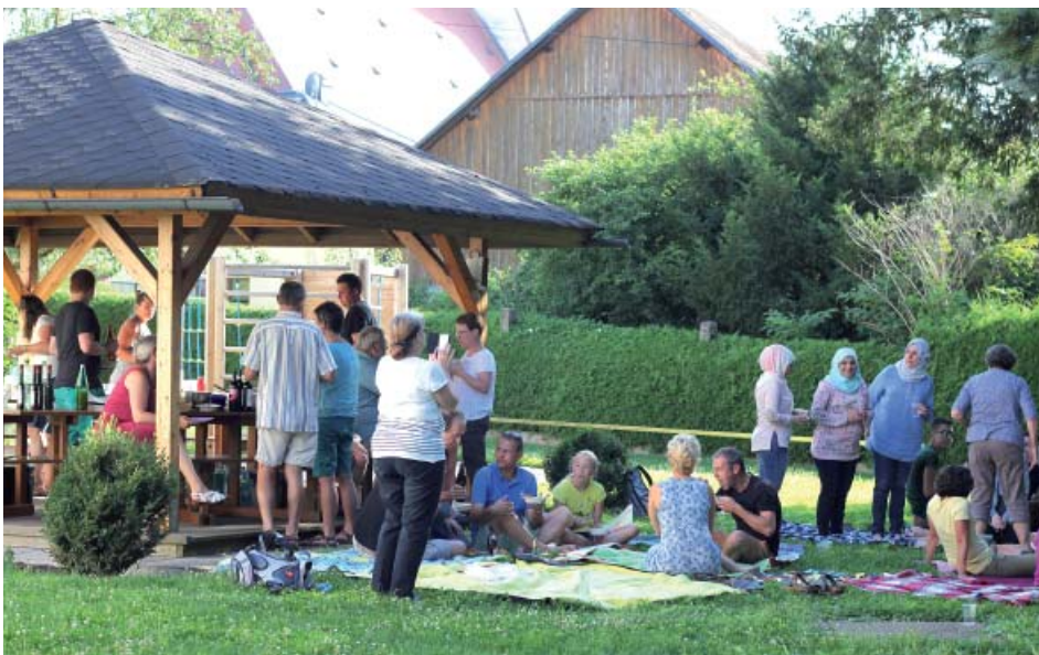
Beim gemütlichen "interkulturellen Picknick" gab es die Gelegenheit, neue Menschen und ihre Geschichte näher kennen zu lernen.

An einem schönen Sommerabend sind über 50 Kilberinnen und Kilber zum "interkulturellen Picknick" in den Garten der Volksschule gekommen. Die vielen mitgebrachten Speisen bildeten ein tolles Buffet mit Köstlichkeiten aus Syrien, Tschetschenien und Österreich. In der lockeren Picknick-Atmosphäre haben sich nicht nur die Kinder schnell zusammengefunden und viel Spass gehabt. Gemäß dem Motto "Beim Essn kumman d`Leit zaum" ergaben sich viele Gelegenheiten neue Menschen und ihre Geschichte besser kennen zu lernen.