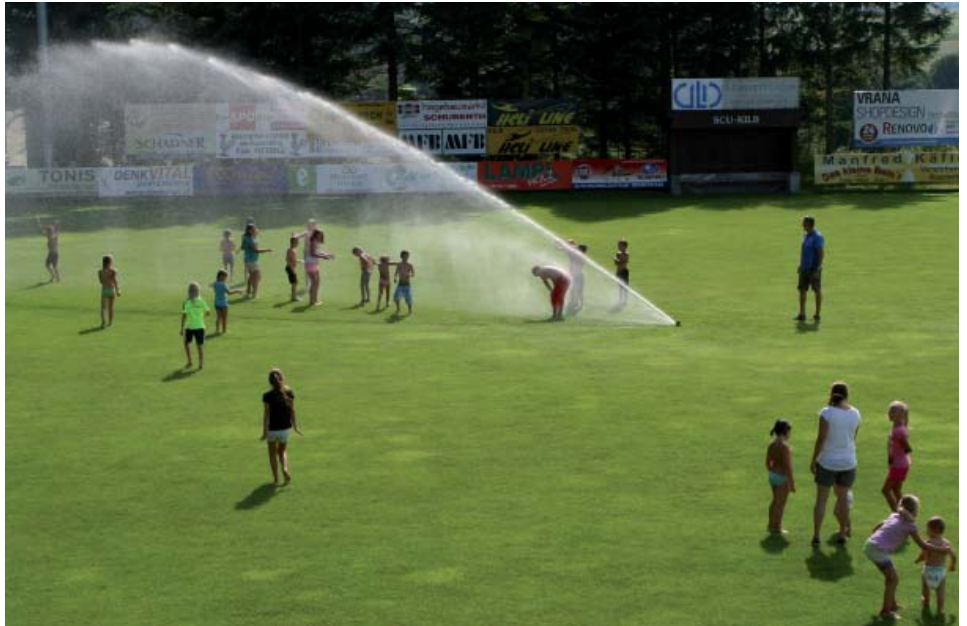
Bei mehr als sommerlichen Temperaturen sorgte die Beregnungsanlage im Waldstadion für eine willkommene Erfrischung nach der Kinderolympiade.

Eröffnet haben wir die Ferienenerlebnistage 2016 im Freibad Kilb. Heuer waren ein Rutschbewerb und Spielestationen geplant. Leider mussten wir nach rund einer Stunde Action abbrechen, weil ein heftiges Gewitter in Anmarsch war. Darüber waren die Kinder sehr traurig, denn es lagen schon einige Spitzenzeiten beim Rutschbewerb vor.