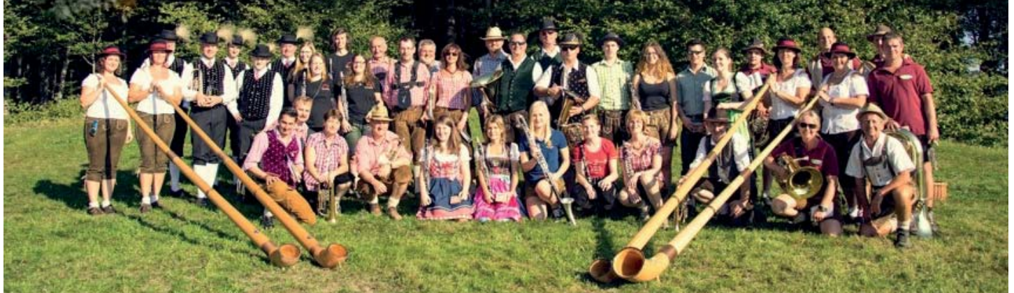
Zahlreiche Besucher nutzten das schöne Wetter, um das Weisenblasen bei der Reitkugel Oacha zu besuchen.

Bei sommerlichen Temperaturen fand das traditionelle Weisenblasen des Musikvereines Kilb statt.