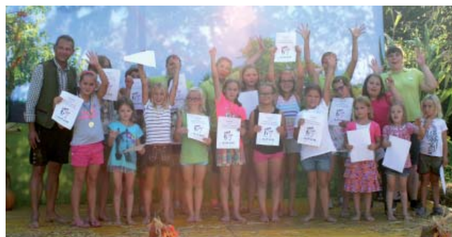
Bei der Kinderolympiade kamen Spaß und Action auf keinen Fall zu kurz.

Für die Stärkung zwischendurch mit kühlen Getränken und Kuchen sorgte der Elternverein der Volksschule gemeinsam mit den Eltern der Kindergartenkinder.