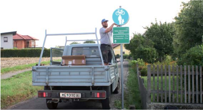
Nach der Fertigstellung des gesamten Radweges von Mank nach Bischofstetten ist er nun auch offiziell für alle Benutzer frei gegeben.

Nach der erfolgten Fertigstellung der gesamten Strecke von Mank nach Bischofstetten und der offiziellen Eröffnung am 22. September ist der Radweg nunmehr auch für alle Benutzer offiziell frei gegeben. Nachdem bereits Kritik an den versetzten Schranken laut geworden ist, wollen wir nicht versäumen, folgende Informationen an Sie weiter zu geben: Die versetzten Schranken wurden im Zuge der Verkehrsverhandlung