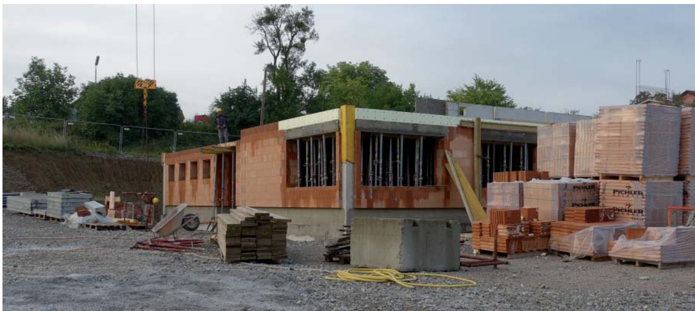
Durch den tollen Einsatz der Feuerwehrmänner sowie auch privater Freiwilliger gehen die Bauarbeiten sehr zügig voran.

Der Rohbau des neuen Feuerwehrhauses in Kilb nimmt von Woche zu Woche mehr Formen an.