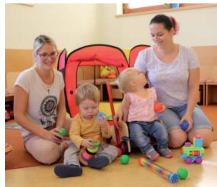
Sehr wohl fühlen sich die jüngsten Gemeindemitglieder im "mini treff".