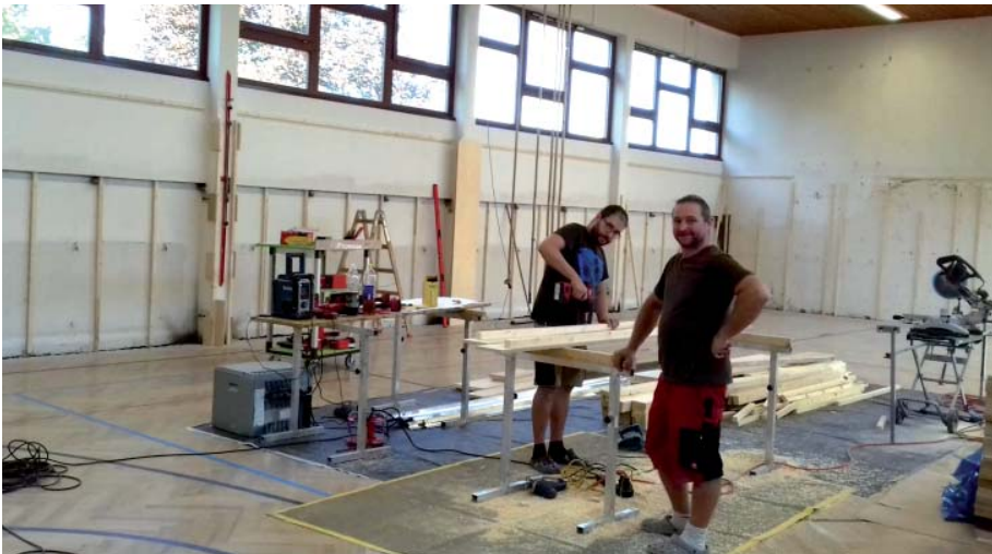
Die Sanierung des Turnsaals geht zügig voran und ab Oktober steht der neu renovierte Turnsaal wieder zur Benützung für alle zur Verfügung.

In der Neuen Mittelschule Kilb wurden über die Sommermonate der Turnsaal, sowie die dazugehörigen Sanitärgruppen komplett saniert. In der Sitzung des Schulausschusses im Mai 2018 wurden die Aufträge an die Firmen mit einer Gesamtsumme von € 529.382,23 inkl. USt. vergeben. Finanziert wird das Vorhaben durch eine Darlehensaufnahme und Förderungen des Landes NÖ.