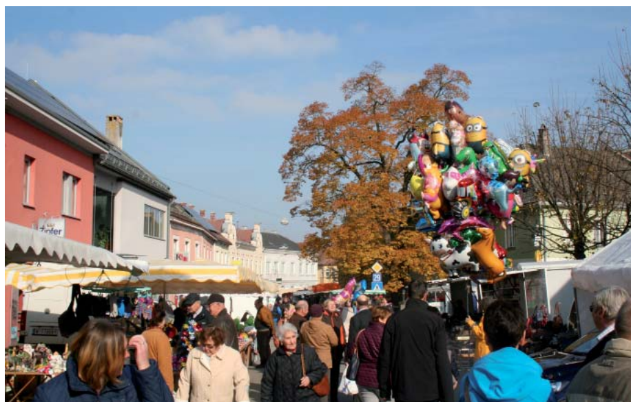
Beim traditionellen Simonikirtag treffen sich Kilber, ehemalige Kilber, "Zuagraste" und Besucher von auswärts zum gemütlichen Beisammensein.

Verbringen Sie gemütlich den Tag in Kilb beim Kirtag und lassen Sie sich kulinarisch von unseren Gastwirten bzw. Gewerbetreibenden verwöhnen.