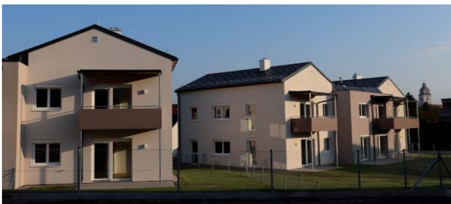
Am 26. September werden die Wohnungen offiziell an die neuen Mieter der Wohnhausanlage Reitnersiedlung übergeben.

Am 26. September wird die neue Wohnhausanlage der GEDESAG in der Reitnersiedlung fertig gestellt und die Wohnungen werden offiziell an die neuen Mieter übergeben.