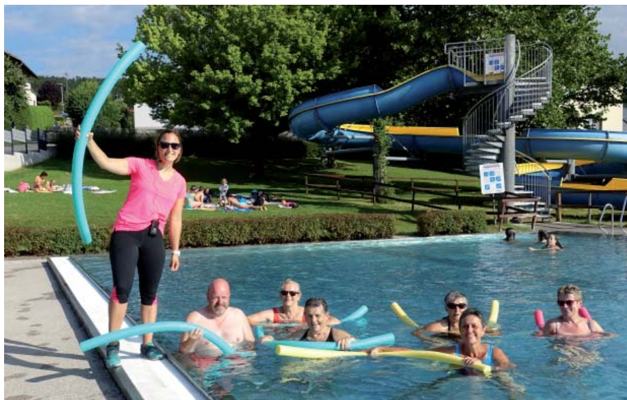
Goßen Anklang fanden heuer auch wieder Gratis-Wassergymnastik und Gratis Aqua Zumba

Wir werden auch im nächsten Jahr versuchen, ein attraktives Angebot anzubieten, um vielen Gästen den "kleinen