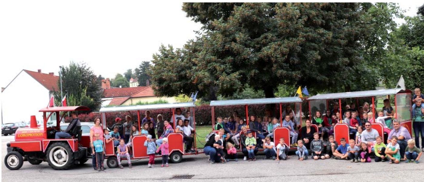
Ein ganz besonderer Spaß für große und kleine Kinder war beim letzten Ferienenerlebnistag die Fahrt mit dem Bummelzug durch die Gemeinde.

Wie Sie auf unserer Homepage die Ferien hindurch verfolgen konnten, gab es heuer zum 11. Mal die Ferienlebnistage nachmittags für unsere Kinder. Dabei wurde ein sehr interessantes und abwechslungsreiches Sommerprogramm angeboten und so besuchten rund 400 Kinder unsere Ferienlebnistage, die kleineren begleitet von den Eltern bzw. Großeltern.