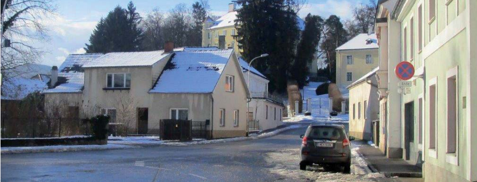
Die Außendienstmitarbeiter der Marktgemeinde sind bemüht, dafür zu sorgen, dass alle Straßen und Gehwege auch im Winter gefahrlos benutzt werden können.

Wie alle Jahre wieder steht der Winter vor der Tür und wir hoffen, dass er nicht zu intensiv ausfallen wird. Um einen möglichst reibungslosen Winterdienst sicherstellen zu können, ist es erforderlich, neben einem gut organisierten Räumdienst auch auf einige wichtige Punkte aufmerksam zu machen: