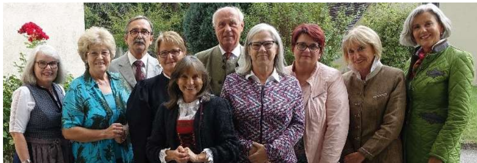
Der Vorstand des Bürger-Sozial-Forum wünscht allen Gesundheit und freut sich schon auf 2022.

Wieder sind die Zahlen der Corona-erkrankungen so gestiegen, dass ein neuerlicher Lockdown angesagt ist. Wieder ist es uns leider nicht möglich Zusammenkommen zu planen, zu organisieren. Es tut uns so leid, wissen wir doch wie vielen unsere Treffen abgehen. Daher können wir nur unsere Bitte aussprechen, nicht auf geistige und körperliche Bewegung zu vergessen, einander