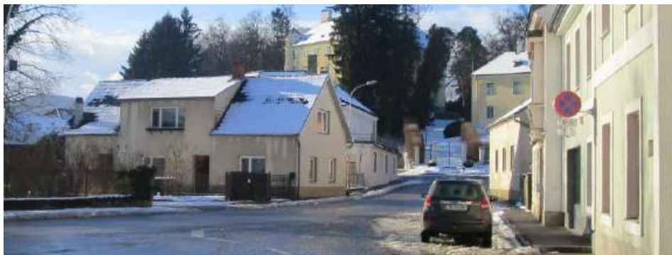
Die Außendienstmitarbeiter der Marktgemeinde sind bemüht, dafür zu sorgen, dass alle Straßen und Gehwege auch im Winter gefahrlos benutzt werden können.

Wie alle Jahre wieder steht der Winter vor der Tür und wir hoffen, dass er nicht zu intensiv ausfallen wird. Um einen möglichst reibungslosen Winterdienst sicherstellen zu können, ist es erforderlich, neben einem gut organisierten Räumdienst auch auf einige wichtige Punkte aufmerksam zu machen: